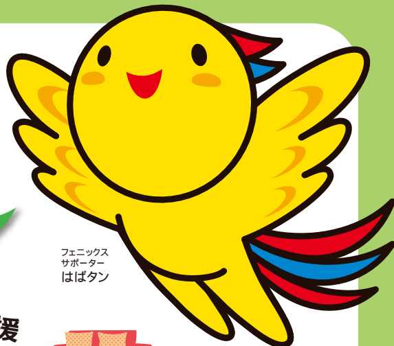
フェニックス サポーター はばたん

フェニックス共済では、これまで半壊以上を給付対象としてきましたが、新たに一部損壊(損害割合10%以上20%未満)を給付対象とする制度(一部損壊特約)が平成26年8月1日からスタートします(加入申込みは4月から受け付けています)。災害への大切な備えとしてぜひ加入の検討をお願いします。